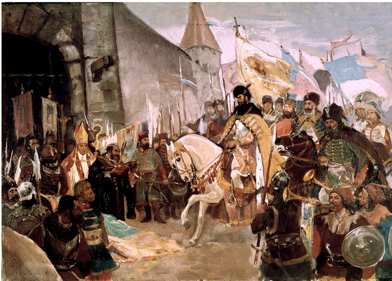
Fig. 6 - Unirea de la 1601 sub Mihai Viteazul

voievozi, devine un principat de sine stătător, vasal Imperiului Otoman din 1526. La cumpăna secolelor al XVI-lea și al XVII-lea Mihai Viteazul domnește pentru o foarte scurtă perioadă de vreme peste o bună parte din teritoriul României de astăzi, el înfăptuind, în fapt, prima unire a principatelor românești.