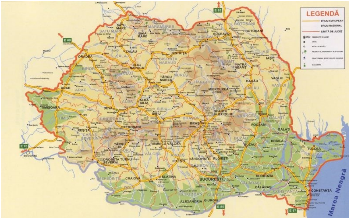
Fig. 1 - Harta României actuală

Prin istoria României, se înțelege, în mod convențional, istoria regiunii geografice românești, precum și a popoarelor care a locuit-o și care, pe lângă diferențele culturale specifice și transformările politice i-au atribuit o identitate specifică.