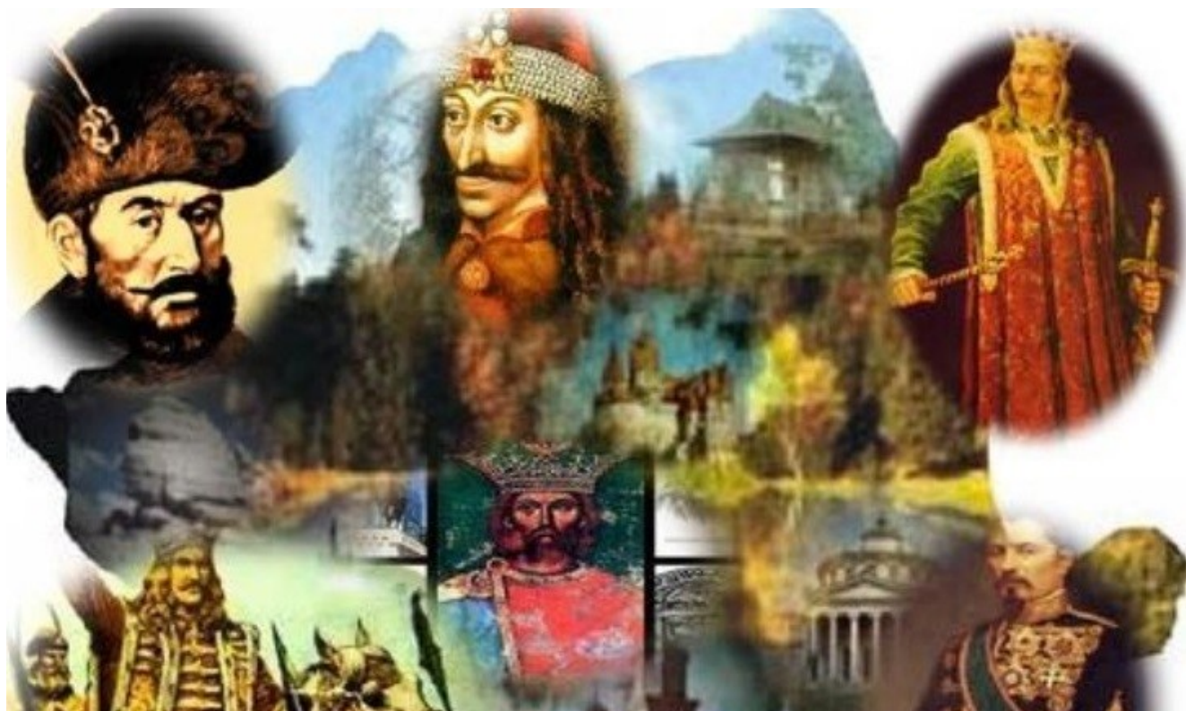
Fig. 5 - Mari domnitori români

În primul mileniu, peste teritoriul României au trecut valuri de popoare migratoare: goții în secolul III - IV, hunii în secolul IV, gepizii în secolul V, avarii în secolul VI, slavii în secolul VII, ungurii în secolul IX, pecenegii, cumanii, uzii și alanii în secolele X - XII și tătarii în secolul XIII. În secolul al XIII-lea sunt atestate primele cnezate la sud de Carpați. Mai apoi, în contextul cristalizării relațiilor feudale, ca urmare a creării unor condiții interne și externe favorabile (slăbirea presiunii ungare și diminuarea dominației tătarilor) iau ființă la sud și est de Carpați statele feudale de sine stătătoare Țara Românească (1310), sub Basarab I și Moldova (1359), sub Bogdan I. Dintre domnitorii ce au avut un rol mai important, pot fi amintiți: Alexandru cel Bun, Ștefan cel Mare, Petru Rareș și Dimitrie Cantemir în Moldova, Mircea cel Bătrân, Vlad Țepeș și Constantin Brâncoveanu în Țara Românească și Iancu de Hunedoara în Transilvania. Începând cu sfârșitul secolului al XV-lea cele două principate intră treptat în sfera de influență a Imperiului Otoman.