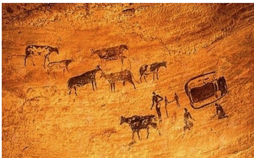
Fig. 3 - Picturile rupestre din Peștera Coliboaia

se măsoară în mii de ani, între 23.000 și 35.000 de ani, adică perioada artei parietale”, mai vechi chiar decât celebrele picturi de la Altamira din Spania, Laas Gaal din Somalia, Chauvet și Lascaux din Franța.[4]